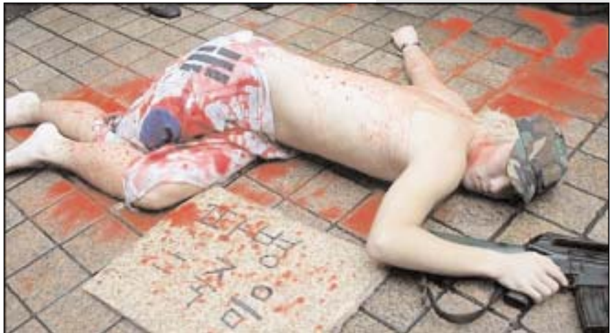
Protesta contra la expansión de la tropas de Corea en Irak, Seúl, 1 de octubre, 2003