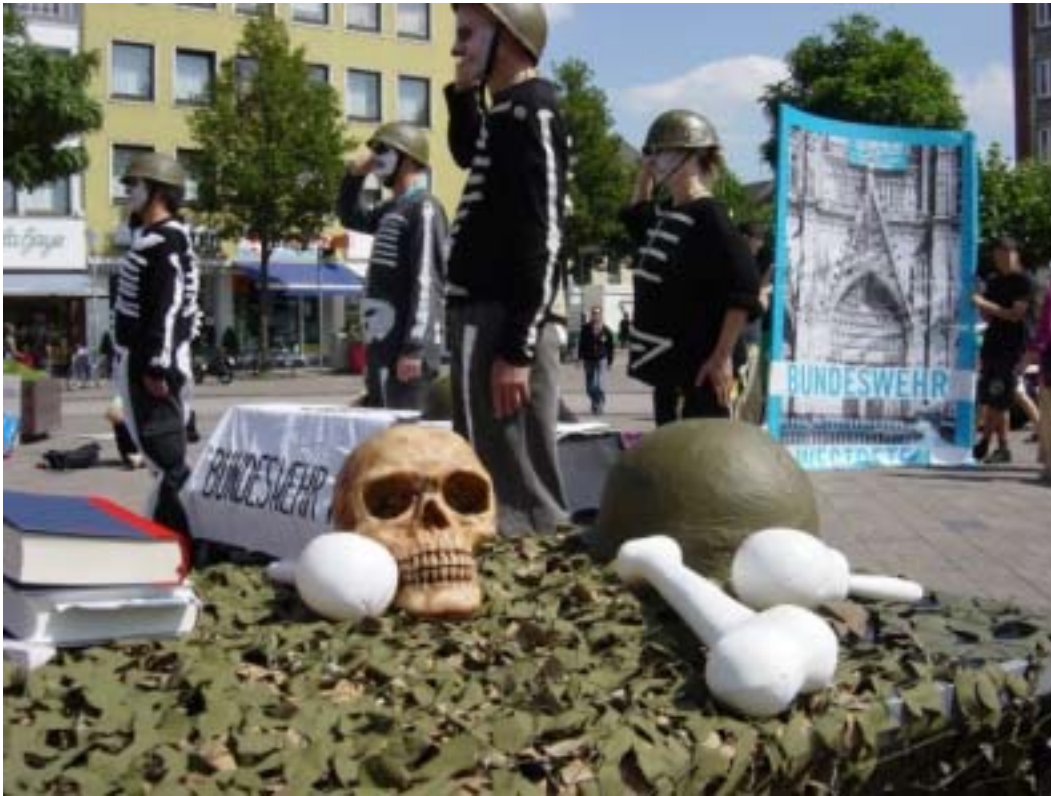
Acción contra la presencia y el reclutamiento militar en Alemania.

15 de Mayo, Día Internacional de la Objeción de Conciencia