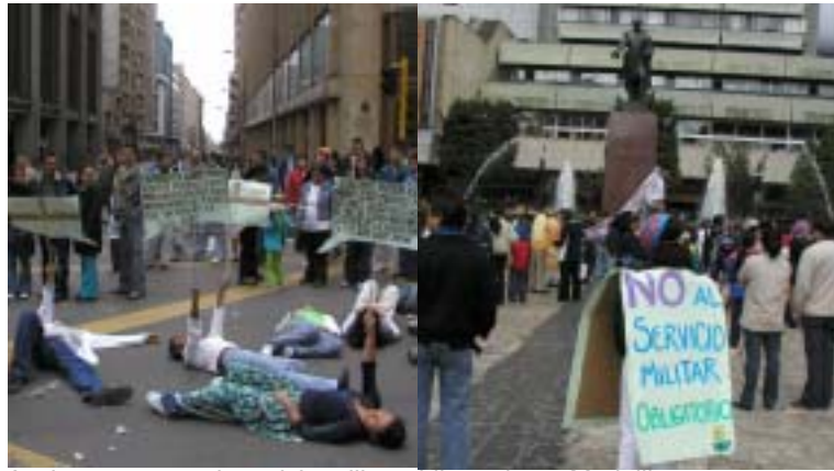
Acciones contra el servicio militar obligatorio en Medellín

Sin embargo, la nueva tendencia a partir de 2003, parece ser, la de aumentar los convocados, disminuir el número de exentos y aumentar en términos absolutos y relativos el número